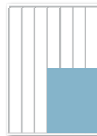
4 sp / 240 mm 182 mm x 240 mm